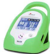
Verde "rana arborícola"