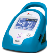
Azul "pavo real"